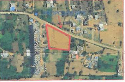
GOOGLE PLAN MAP

योजना का नाम BALAJI VIHAR RESIDENTIAL SCHEME का ले-आउट आज दिनांक 12/11/24 को लेआउट प्लान कमेटी द्वारा सर्वसम्मति से अनुमोदित किया गया।