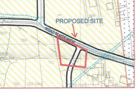
SECTOR PLAN MAP

TOTAL AREA OF KH. NO. 2591/1817 =4845.00 SQ. MTR TOTAL AREA FOR CONVERSION=4845.00 SQ. MTR