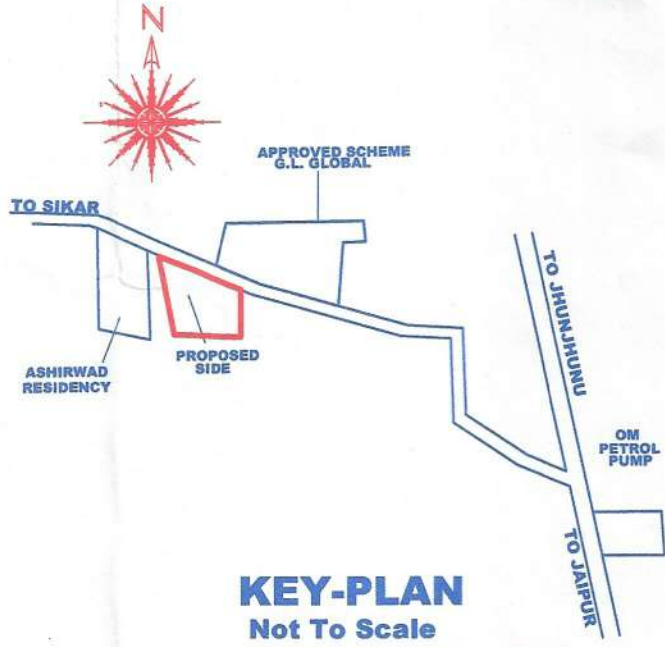
KEY-PLAN Not To Scale