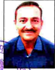
क्रेता की फोटो