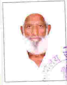
विक्रेता की फोटो